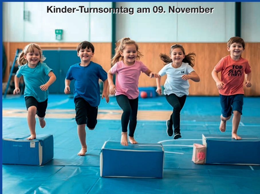
Kinder-Turnsonntag am 09. November

tus BERNE Fußball-Jugend beim internationalen Turnier in Haderslev