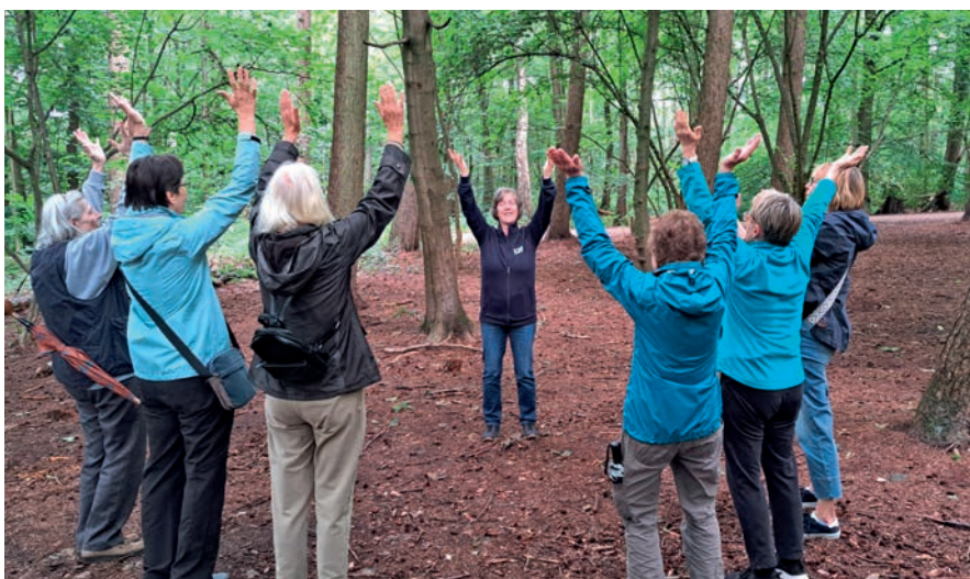
Die andere Sportstunde: Den Wald mit allen Sinnen erfahren