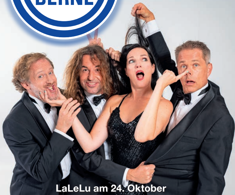
LaLeLu am 24. Oktober