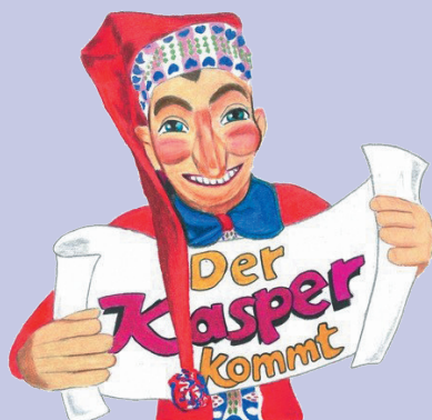
Der Kasper kommt am 02. Dezember

MADSINO'S PUPPENREVUE Figurentheater für Kinder