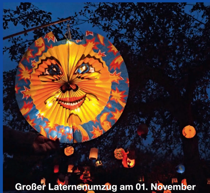
Großer Laternenumzug am 01. November